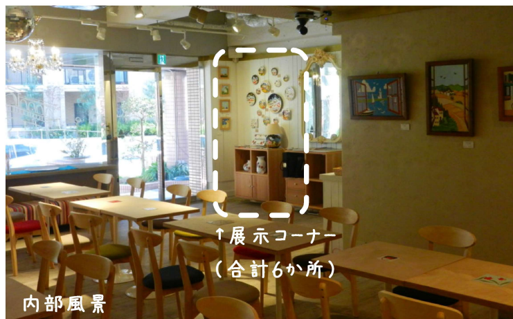
↑展示コーナー (合計6か所)